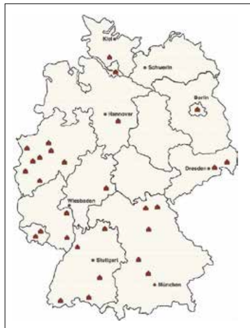
Wo die bisherigen EVD-Mitglieder zu Hause sind.

FÜR 500 EURO IN DEN EVD. Schaffraths Einkaufsverbund Druck (EVD) adressiert bislang nur den Faktor „Beschaffungskonditionen“. Das Prinzip der